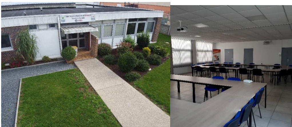
Salle de cours